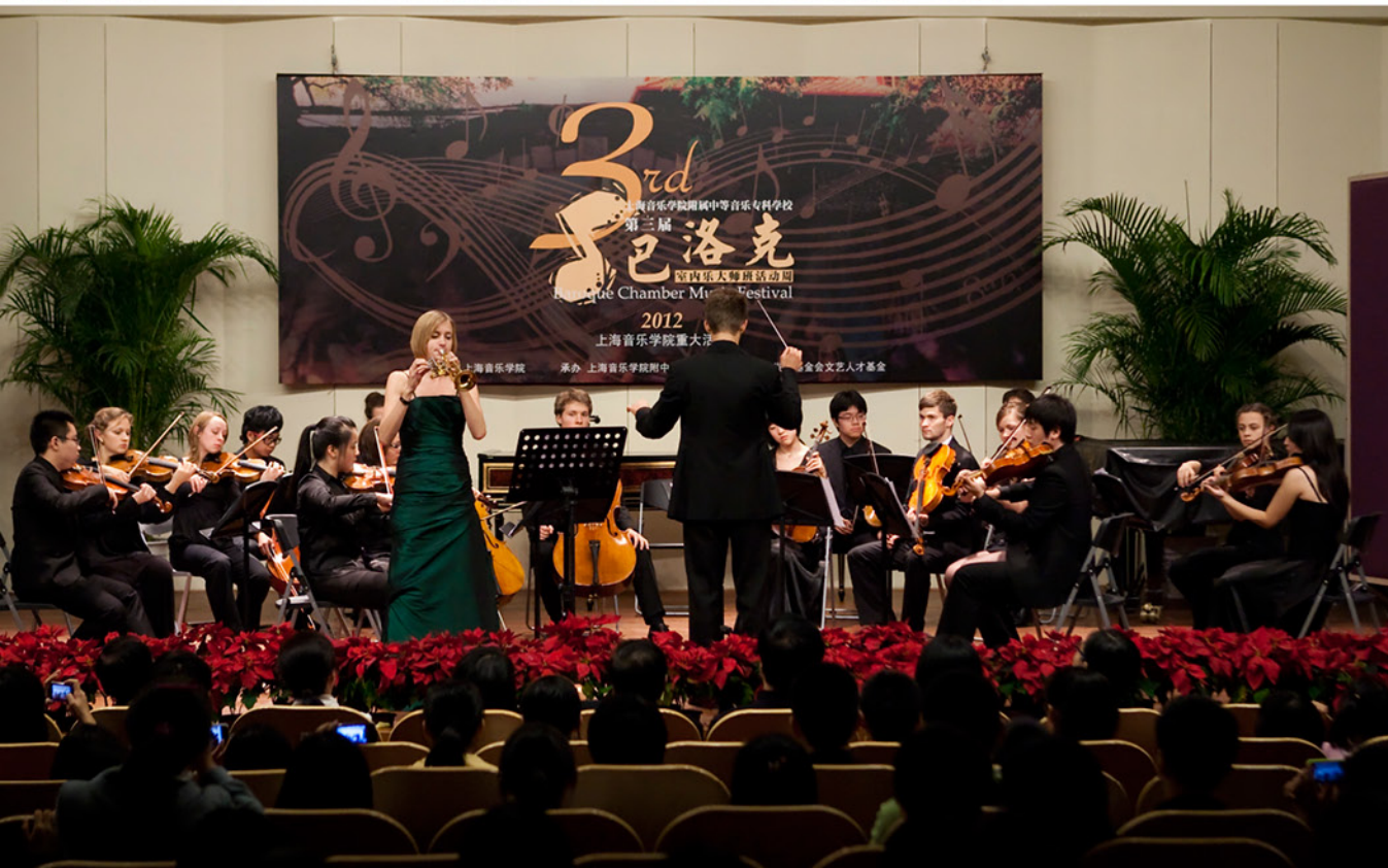
第三届巴洛克 室内乐大师班 活动周闭幕式音乐会 ▼

2012 SHANGHAI 22nd Nov To 3rd Dec 9th Dongping Road