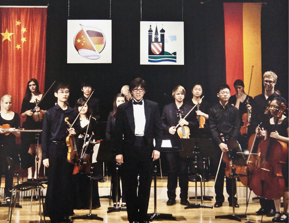
◀ 中德学生交流演出