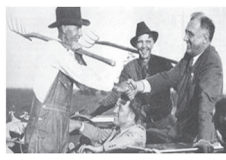
图二 罗斯福当选总统后 与美国农民交谈