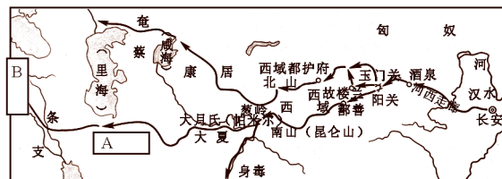
图二 丝绸之路线路图