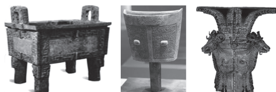
图一 司母戊鼎 图二 饅 图三 四羊方尊