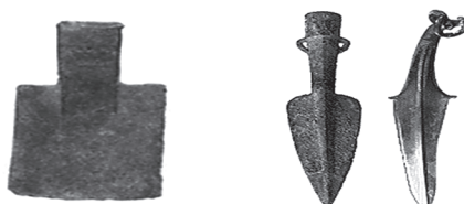
图四 铲 图五 矛

材料二 司母戊鼎高约 1.33 米,长约 1.1 米,重 832.84 千克,是世界现存最大的青铜器。当时,铸造这样一个大鼎,需要二三百人同时操作,可见商朝的青铜铸造业有多么大的规模了。