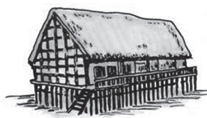
图一 河姆渡居民房屋复原图