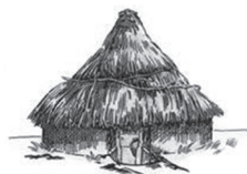
图二 半坡居民房屋复原图