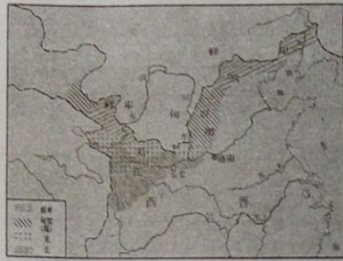
图一 西晋时期内迁的少数民族

38、秦汉以来，相比黄河流域，江南地区开发缓慢，经济落后。但到了东晋南朝时，却迎来了一次发展的机遇，造就了中国古代经济发展的一抹亮丽。(10分)