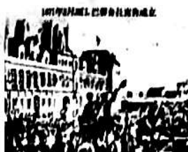
巴黎公社成立 图一