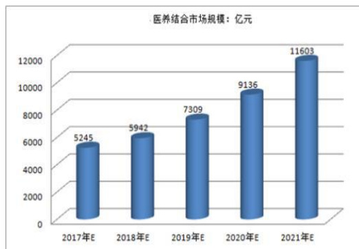
图 2. 2017-2021 年医养结合市场规模趋势图

“_____。”近两年,一种新的智能互助养老服务模式——“时间银行”逐渐兴起。在这个特殊的银行里,时间是唯一受认可的“货币”,会员通过为他人提供服务采蓄时间,声自己需要帮助时,再从银行提取时间以获取他人服务。