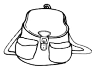
a red schoolbag