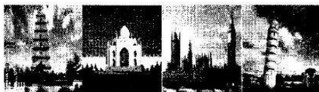
a.大雁塔 b.清真寺 c.大本钟 d.比萨斜塔

(2)九(2)班的学生计划设计“中法文化年”活动,并向有关部门提出自己的设计建议。请你结合相关知识回答下列问题。