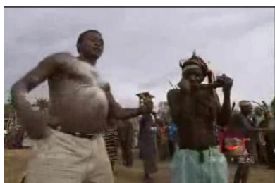
非洲多哥部落舞蹈