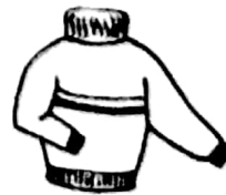
羊毛衫 180 元