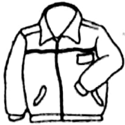
夹克衫 280 元