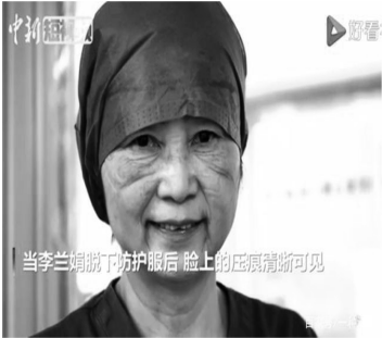
73 岁的李兰娟院士脱下防护服满脸压痕