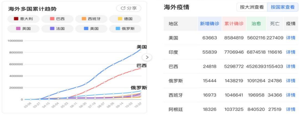
【材料三】海外新冠疫情数据统计图

17. 阅读【材料一】，这是一则新华社发表的国际时评新闻，请给这则新闻拟一个恰当准确的标题。（2 分）