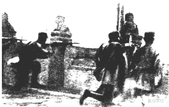
图一 中国守军在卢沟桥抗击日军