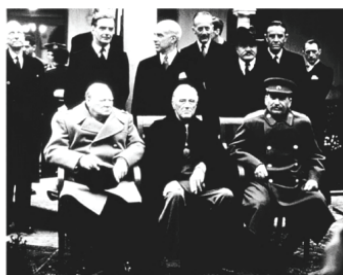
B 会议三巨头 丘吉尔、罗斯福、斯大林