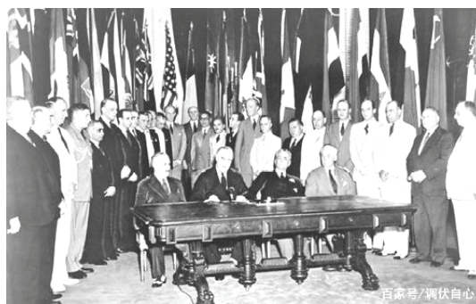
图二 《联合国宣言》签字仪式

材料一 假如没有中国, 假如中国被打垮了, 你想一想有多少个师团的日本兵, 可以调到其他方面来作战, 他们可以马上打下澳洲, 打下印度……他们可以毫不费力地把这些地方打下来, 他们并且可以一直冲向中东。