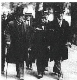
A 会议三巨头 劳合·乔治、克里孟梭、威尔逊