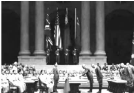
1945年日本投降,世界反法西斯战争胜利