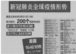
全球新冠肺炎疫情形势