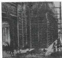
英国东印度公司 的鸦片仓库 A