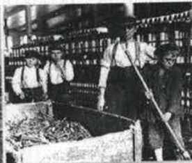
英国工厂里的童工 C