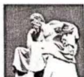
图二、苏格拉底雕像

材料二：苏格拉底出生在公元前 4 世纪的希腊雅典一个普通家庭，是希腊历史上伟大的思想家、教育家、西方哲学的奠基者。他一生从未著书立说，思想全是死后其弟子的作品中记载流传下来的。他智慧博学，研究人类本身的道德伦理，终身探讨人的灵魂、美德和幸福等问题，认为有系统的问和答是求得知识的最好办法。孔子生于公元前四世纪的鲁国，是中国古代伟大的思想家、教育家，当时最博学多才的学者之一，门生三千人，成名者七十二人，可谓是桃李满天下。孔子主张“为政以德”，用道德和礼制来治理国家。他前后十四年周游列国，游说各国君主施行自己的治国理念。却无一国真心实意采用他的思想。晚年孔子编订了大量文化典籍，死后其弟子将他的言论编辑成《论语》一书，影响了千秋万代的华夏人民。其所创立的儒家学说被汉武帝尊为国学，日后成为华夏文明的主流价值观，他所崇尚的礼制终于被后世践行。