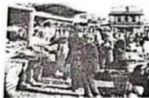
图一.1921 年苏俄农贸市场

25. (5分) 请对比下面图片反映的历史信息, 并结合所学知识, 写一篇 80-120 字的小短文。 (要求: 题目自拟, 史实正确, 语句通顺, 表述完整, 体现两幅图片反映内容之间的对比。)