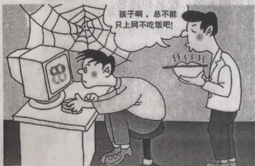
七年级期中质量检测语文试题 第 7 页 共 10 页