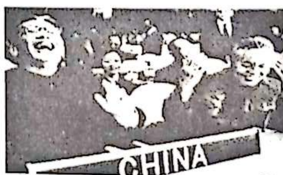
图二第26届联大上“乔的笑”（1971年）