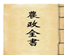
图二《农政全书》封面