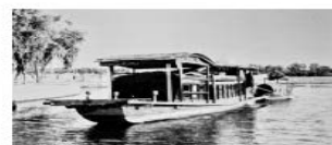
图三嘉兴南湖游船