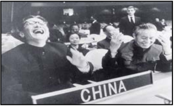
第 9 题图