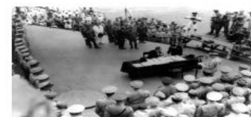
图四 美国“密苏里”号