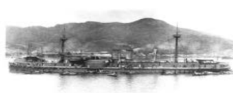
图二北洋舰队“定远号”铁甲舰