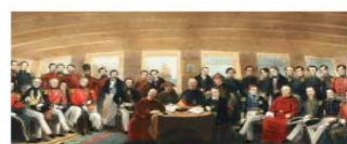
图一 英国军舰“皋华丽”号