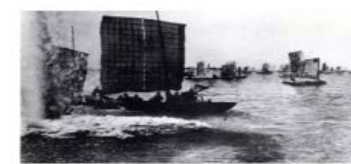
图五人民解放军强渡长江