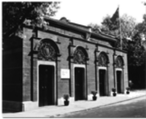
“中共一大”上海会址