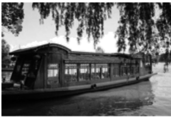
浙江嘉兴南湖的“红船”