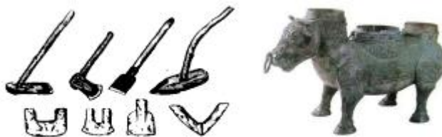
春秋战国时期的农具和穿有鼻环的牛尊

材料二：西汉初年，由于秦末的暴政和连年战乱，土地荒芜，经济萧条，皇帝出巡时连四匹同一颜色的马都找不到，将相只能乘坐牛车。