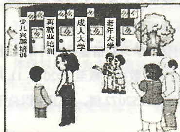
题 18 图

19. 2020 年中国“最美职工”王曙群在航天装配岗位上工作 30 多年，凭借不服输的劲头，他加班攻关、苦练技能，练就了一手“精、新、准、快”的绝技绝活，荣获 5 项国家发明专利。王曙群最让人敬佩的是