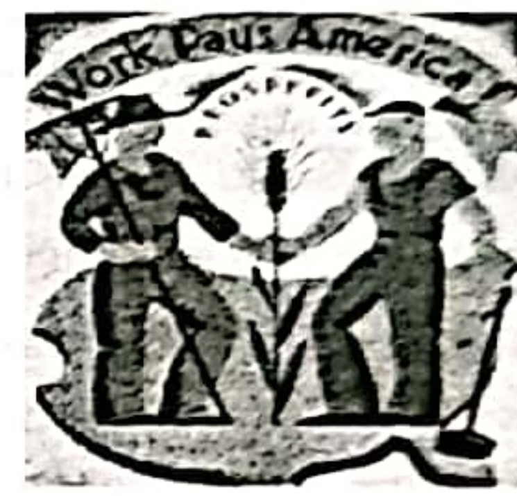
图 2 “以工代赈”