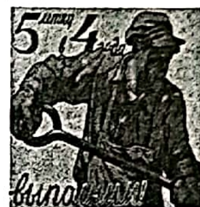
图 1 “五年计划”