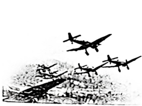
图一 第一次世界大战时德军飞机在空中