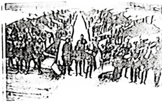
图二 英国成立统一的皇家空军

注:飞机最初用于军事主要是从事侦察任务,直到第一次世界大战,才大规模出现专门为执行某种任务而研制的军用飞机,如主要用于空战的歼击机,专门用于突击地面目标的轰炸机和用于直接支援地面部队作战的强击机。大战初期,参战各国约有飞机 1500 架,而到战争末期,各国在前线作战的军用机达到 8000 多架。在战争中,飞机的飞行性能和作战能力都有很大提高。1914 年时飞机速度一般是每小时 80~115 公里,4 年后增至 180~220 公里;飞行高度从 200 多米提高到 8000 米;可执行近距支援、空中格斗等更复杂的空中作战任务。随着飞机在战争中作用的加强,空军逐渐脱离陆、海军,成为一个独立的军种。1918 年 4 月英国成立统一的皇家空军,它的建立标志着世界军事史的重要转折与发展。