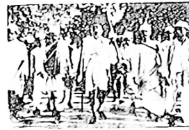
图二 非暴力不合作运动

图一：17世纪初英国成立东印度公司。殖民者借经商贸易之名，对印度实行疯狂的掠夺。据统计，仅1757—1815年间，东印度公司从印度就榨取了10亿英镑的财富。英国殖民者对印度人民的剥削和压榨，引起印度民众对立情绪不断增长，终于爆发了大起义。1857年5月10日，起义首先在密拉特爆发。各地士兵和民众纷纷响应，不到4个月，起义烈火迅速燃遍几乎整个北印度。这次起义虽然失败了，但它提高了印度人民的觉悟，延缓了西方资本主义国家侵略亚洲的速度。1858年8月，英国政府撤销了东印度公司对印度的统治权。