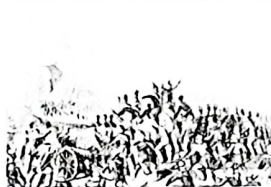
图一 印度民族大起义