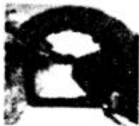
古希腊运动场入口