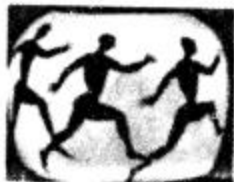
古希腊画板上跑步的运动员