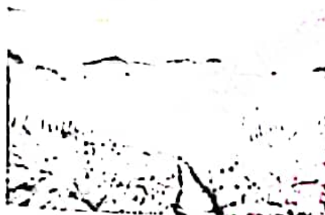
古希腊奥林匹亚体育场遗址