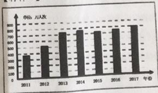
图1 国博接待观众总量统计