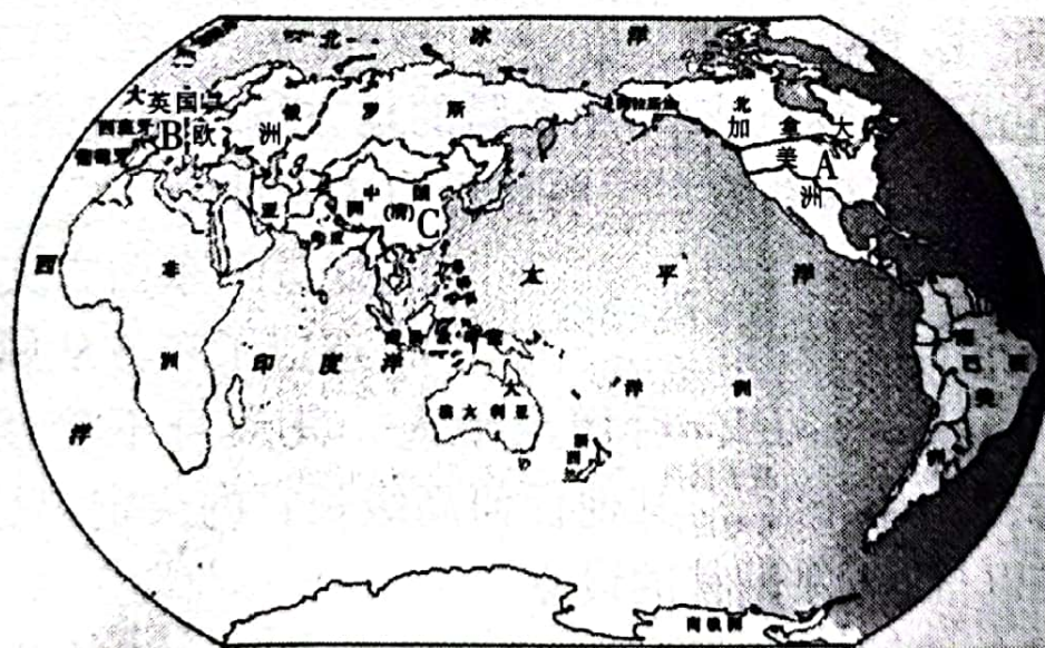
鸦片战争前的世界和中国

(1)上图中 A、B 两国分别是通过什么方式走上资本主义发展道路?(2分)C 处是清朝前期唯一对外贸易的口岸,请写出该城市的名称。(1分)