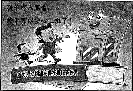
图 1 构建完善托育服务体系