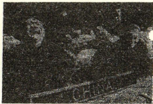
1971年中国代表团在第26届联合国大会上。