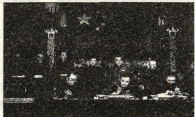
1951 年 5 月 23 日,西藏和平解放协议签字仪式。