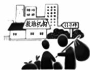
救助流浪乞讨人员