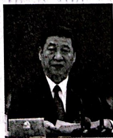
习近平在中国共产党第十八届中央委员会第一次全体会议上的讲话