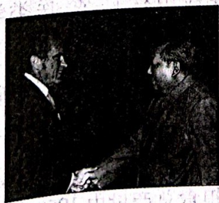
毛泽东会见尼克松

23. (5分) 请根据下列图片反映的历史信息, 结合所学知识, 写一篇80—120字的小短文, (要求: 题目自拟, 史实正确, 语句通顺, 表述完整, 体现图片内容之间的联系)