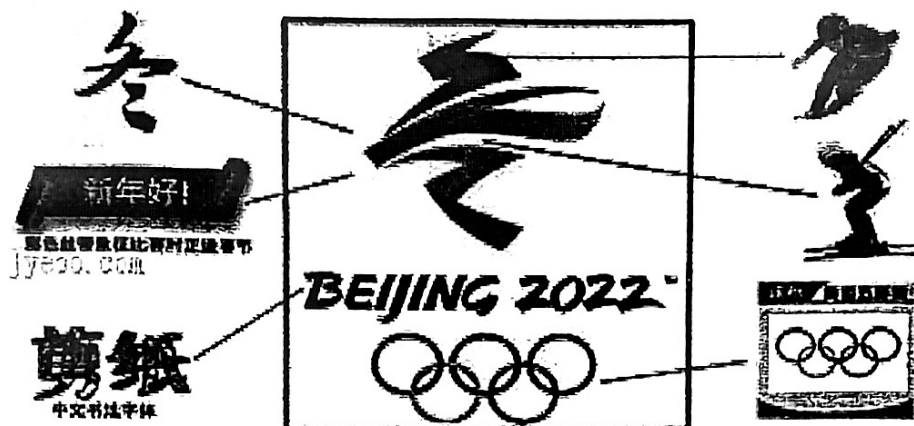
2022年北京冬奥会会徽“冬梦”素材示意图

冬奥会会徽美好的形象背后隐藏着文化属性。小小的冬奥会会徽体现了各民族、各国家的文化内涵，促进了不同民族文化的交流，增进了大众对不同民族文化的吸收与融合，推动了会徽的国际化发展。此外，冬奥会会徽不仅要体现出“相互理解、友谊、团结和公平竞争”的奥林匹克精神，而且还要加入冰雪文化，在文化层面上区别于夏季奥运会会徽。冰雪文化不是一个雪花图形所能代表的，它是层次性和功能性的意识形态统一体，是知冰识雪的各族人民在特定的时空里形成的一种文化形态。2022年北京冬奥会会徽“冬梦”就完美地体现了这些共有的文化属性，即(1)、国际性、奥运精神和(2)。