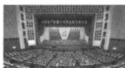
中共十九大胜利召开