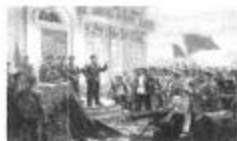
打响反国民党统治第一枪