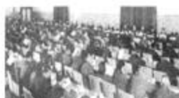
中共十一届三中全会会场