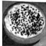
B. 河姆渡遗址出土的稻谷