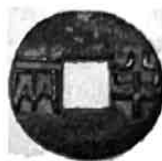
D. 秦朝圆形方孔半两钱

2. 西周时期,“一人跲(踏)耒而耕,不过十亩”,而到了战国时期,“一夫挟五口,治田百亩”。从生产力发展的角度分析,引起这一变化的主要原因是