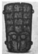
C. 夏朝二里头遗址出土的铜牌