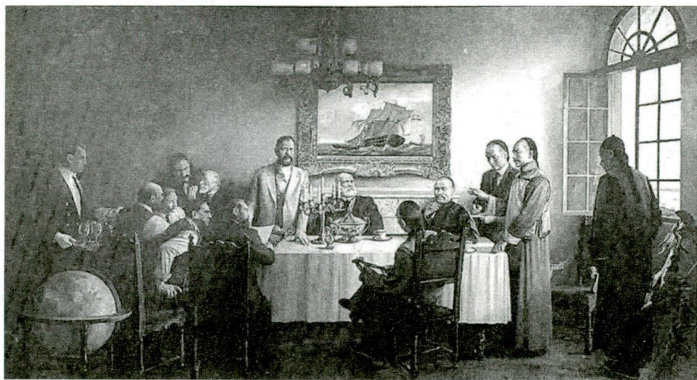
图 1:招商局收购美商旗昌轮船公司