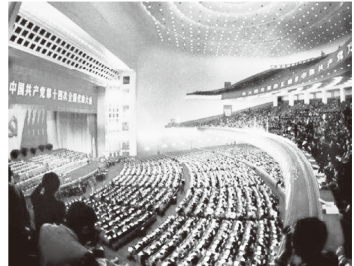
图二:党的十四大提出建立社会主义市场经济体制,三十年来中国经济突飞猛进。