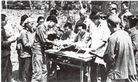
图一:凤阳县小岗村农民实行家庭联产承包制,一年后全村粮食生产获得大丰收。

为了迎接党的二十大,党史兴趣组制作了主题板报,回顾了中国共产党自成立以来波澜壮阔的百年征程。下面是乐乐同学选取的两幅党史图片: