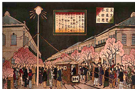
19 世纪末日本街道安装了电灯

(1) 材料一中的图文分别反映了日本历史上哪两次著名的改革运动? (4 分) 结合所学知识, 举出一个具体事例, 说明第二次改革运动后日本对亚洲邻国的影响。(2 分)