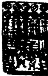
北宋纸币 铜版拓片