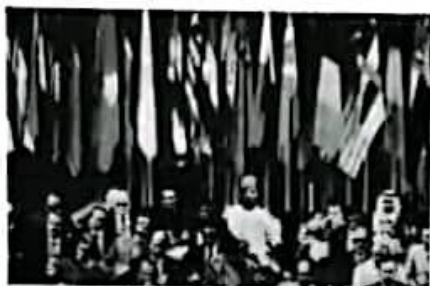
1961 年, 不结盟国家和政府首脑会议会场