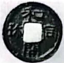
日本的和同开珎 (唐玄宗时流入中国)