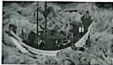
《弘法大师行状绘词》 (日本僧人渡海入唐的情景)