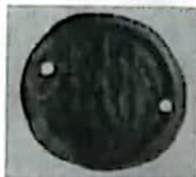
东罗马金币 (唐朝墓葬出土)