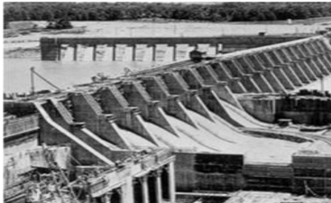
美国田纳西水利工程