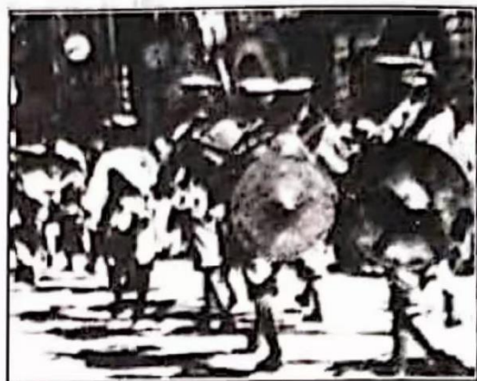
图1 上海租界巡捕房的英国巡警 图2 国民革命军一部开入英租界维持秩序

图1 租界是指近代历史上帝国主义列强通过不平等条约强行在中国获取的租借地的简称，租界多位于港口城市。1845年，第一任英国驻上海领事巴富尔以《南京条约》、《虎门条约》有关允许英人在通商口岸租地建屋的规定，胁迫苏松太道宫慕久同意租出一块地段，供外人长期占据。双方经反复交涉，议定《上海租地章程》，凭此英国在上海勒索到第一块租界。从上海开始，至1902年奥匈帝国在天津设立租界，列强在中国共获取27块租界，其中有25块是租借国单一的专管租界，还有2块公共租界。《上海租地章程》规定英国领事对租界内的外国人有专管之权，无须中国官吏过问，租界成为“国中之国”。