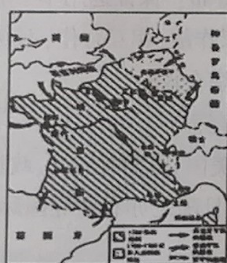
图三 法国革命形势图

(1) 结合所学知识指出材料中的资产阶级革命爆发的共同原因是什么? 请你选择其中一次革命谈谈其影响是什么? (4 分)