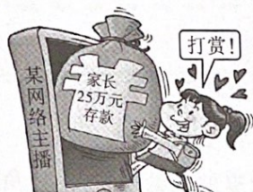
题 10 图

10. 面对题 10 图所示的“打赏”, 《关于规范网络直播打赏 加强未成年人保护的意见》有了回应。这说明