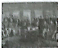
图一 中国近代第一个不平等条约的签订