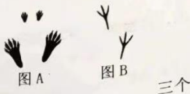
图 B 是_____的足迹

19. 作者从_____、_____、_____三个方面说明狼的足迹和狗的足迹不同。（3分）