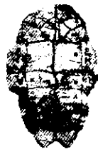
图 1 刻有文字的甲骨