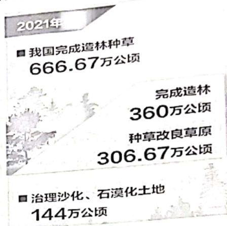
2021年中国国土绿化状况公报